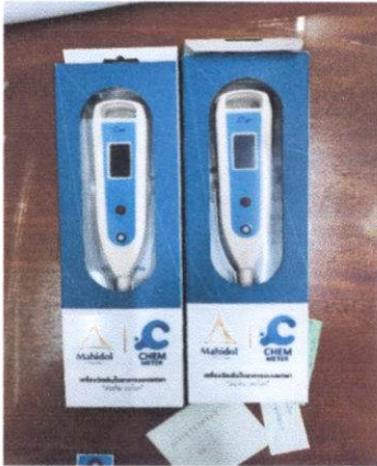
เครื่องวัดความเค็ม (salt meter )