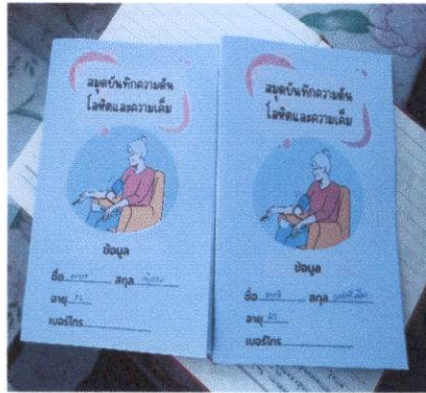
สมุดบันทึกความดันโลหิตและความเค็ม