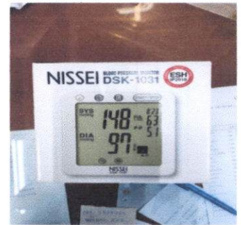
เครื่องวัดความดันโลหิต